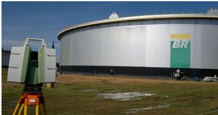
Laser Scanner 3D da TerraScan em campo

Fizeram parte da entrega também, outras peças técnicas criadas em desenhos 2D, de forma a quantificar detalhadamente e precisamente estes desvios em toda a extensão do costado, verticalmente e radialmente.